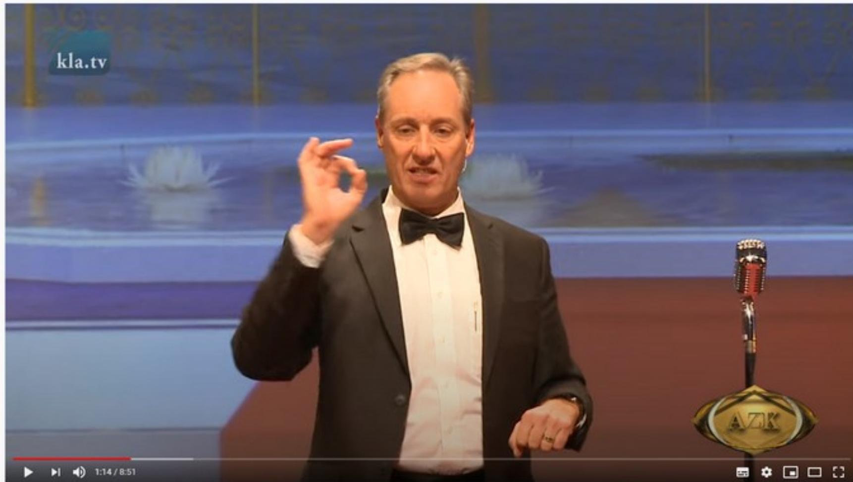
#KlaTV #AZK17 #IvoSasek 17. AZK: Ivo Sasek: Unser Sieges-Potential